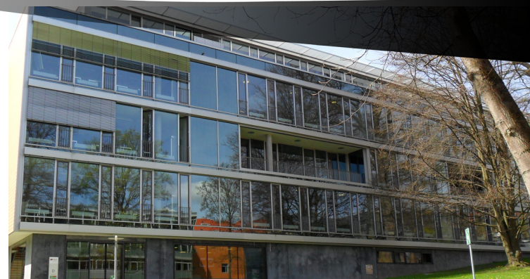
Gebäude D, Raum 007 Friedrich-Ebert-Straße 30, 78054 Villingen-Schwenningen